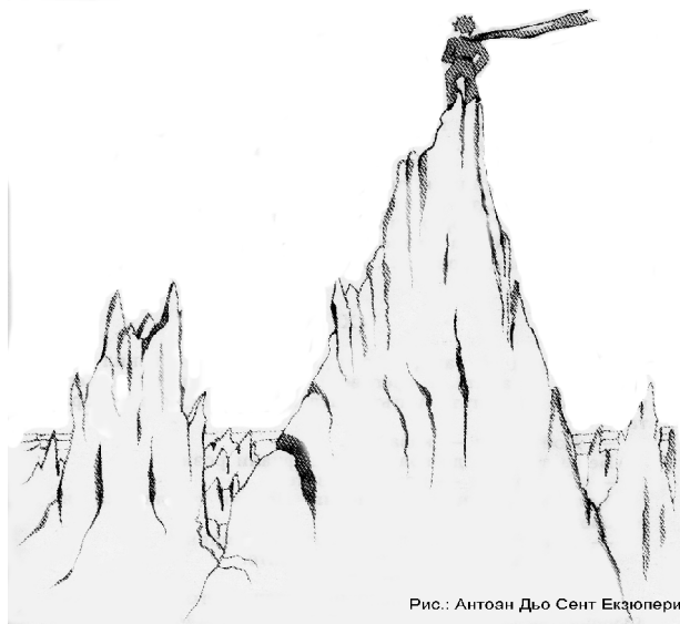
Рис.: Антоан Дьо Сент Екзюпери

Златомира Кулчева – ученичка Горна Оряховица