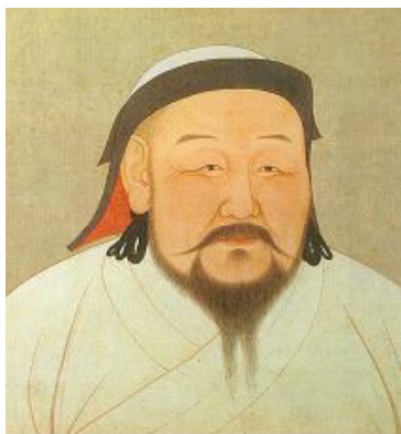
Хан Кублай (Хубилай)

крено се зарадвал на тяхното завръщане, но не скрил изненадата си от придружаващия ги младеж и проявил жив интерес към него. Симпатията, която Великият хан проявил към Марко Поло още при първата им среща, с времето прераснала