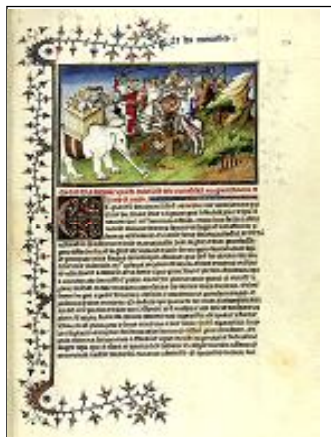
Факсимиле на страница

каз, отколкото на реалистично сериозно свидетелство с научна и практическа стойност.