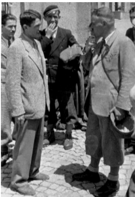
Фиг. 1. Професорът „изпитва“ доцента