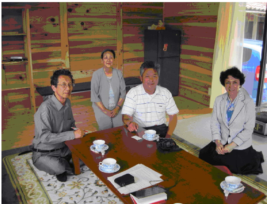
Фиг. 4. Авторите интервюират собственика на селска къща Кикория, Район Хаги, Префектура Ямагучи. Интервюто се провежда в новопостроена дървена къща. Тя е изградена по местни традиции, с дървен материал от непосредствената околност. Всяка дъска е закована от турист-гост на къщата. Ако желае, гостът може да напише името си на дъската, така, че когато дойде отново след години, може да си спомни как се е учил да строи дървени къщи.

Fig. 4. The authors interview the owner of a rural tourist house (Kikoria, Nagi region, Yamaguchi prefecture).