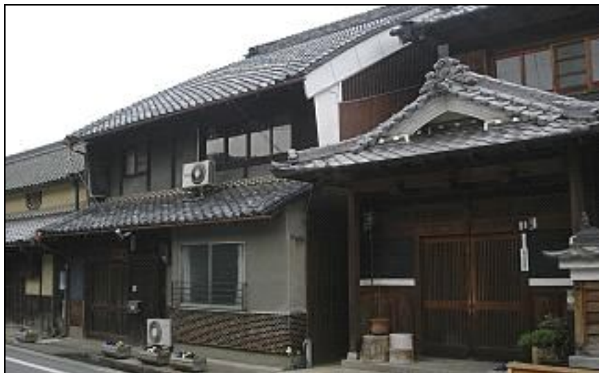
Фиг. 3. Селска къща в префектура Ямагучи, която предлага гостоприемство за туристи

От направените интервюта със собственици на селски къщи става ясно, че предварителната информация за възможности за предлагане на къщи за селски туризъм идва най-често случайно – по линия на предавания по радиото и телевизията, разговори с приятели и др. Интересно е да се отбележи също, че едни от най-успешните къщи започват дейността си в резултат на връзки с университетски преподаватели. Но при всички интервюирани следващата решаваща стъпка е била посещение в Отдела по туризъм към Префектурния офис, откъдето получават специализирана информация и консултации. С други думи – решаващо значение има подкрепата на регионалните органи на властта в страната. Тази помощ не спира само до предварителните консултации и регистрацията; тя продължава постоянно, с осигуряване на реклама,